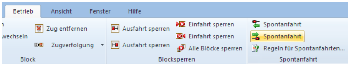
Abbildung 31: Spontanfahrt nach rechts starten

Nun markieren Sie „Block 1“, d.h. den Block, in dem sich die Lok gerade befindet, und wählen das Kommando Spontanfahrt nach Rechts in der Gruppe Spontanfahrt der Registerkarte Betrieb .