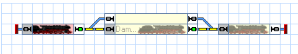
Abbildung 32: Spontanfahrt

Die Anzeige im Stellwerk sollte nun in etwa folgendermaßen aussehen: